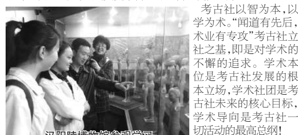
汉阳陵博物馆参观学习

考古社卓然而立，剑走偏锋。“三人行必有我师”考古社荟萃西中顶尖文史人才，引为同侪，切磋学问，坐而论道。为西中学子搭建最专业、最纯净的文史交流平台。为文科生提供一方天空！