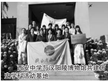
西安中学与汉阳陵博物馆共建历史学科活动基地

为全面落实《中共中央国务院关于进一步加强和改进未成年人思想道德建设的若干意见》，深化开展新一轮课程改革，加强校外实践教育基地建设，西安中学与汉阳陵博物馆于2015年完成了历史学科汉阳陵活动基地的建设工作，从而为考古社学员走出校门亲身实践提供了良好的平台。自2013年至2015年，考古社连续3年举办走进汉阳陵博物馆实践体验活动，为了将户外学习落到实处，西安中学历史组和博物馆为学员精心设计了陈列参观、文物修复、模拟考古、影视观赏和墓葬文化体验等课程，先后有140名社员完成体验，取得了“广播种、齐丰收”的良好效果；除了“走出去”，考古社积极还“引进来”，邀请汉阳陵博物馆优质讲座和课程走进西中，涉及文物保护、古代服饰和汉代体育等主题，活动中同学们既是聆听者，也是参与者，在互动环节中同学们炫知识、炫自信、炫青春、炫梦想，留下了难忘的幸福足迹。