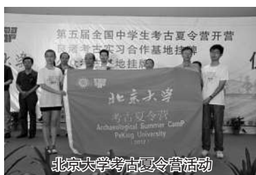
北京大学考古夏令营活动

考古社自成立以来多次推荐优秀学员参加北京大学等名校考古夏令营活动，为学生以后更好地参与自主招生提供了机会与平台。2015年12月西安中学考古社与北京大学文博学院正式建立互动机制，北大文博学院施老师和鸣鹤书院李老师承诺每年5月将邀请西中考古社2名学员参加活动，在夏令营活动结束之时，将根据学生在活动期间的表现并通过适当形式的考核，选拔优秀营员，推荐参加北京大学自主选拔录取笔试，笔试通过者可免面试获得北京大学自主选拔录取候选人资格，享受相应优惠政策。夏令营活动使学生们暂时离开书斋，走向田野，一起体验考古的艰辛和浪漫，共同感受先民的智慧与荣光，完成了真正的古代文明之旅！