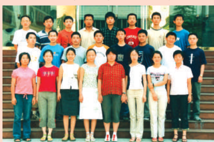
2003年我校考入清华、北大同学合影